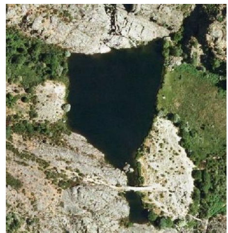
7. Vista aérea de la Poza de la Cueva San Martín de Castañeda (Zamora)