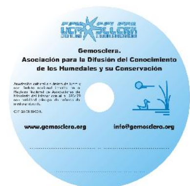
9. Prototipo de carátula para CD y DVD