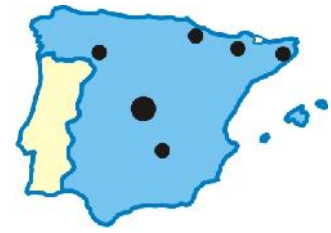
2. Mapa de actividades en 2011

Así mismo se han realizado actividades internas para alcanzar la estabilidad y permanencia de la asociación.