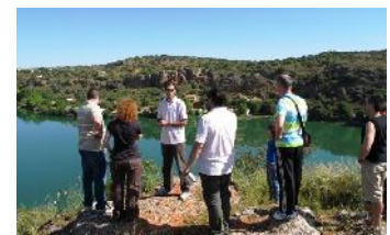
4. P.N. Lagunas de Ruidera