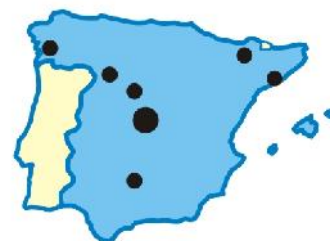
6. Distribución de recursos actual