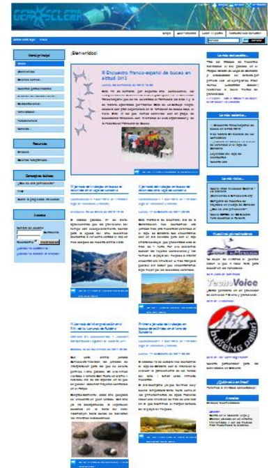
5. Aspecto actual de la web

Durante este año la asociación ha informado de sus actividades a los colectivos interesados en buceo y ha intentado publicitar a aquellas empresas que ofrecen servicios sostenibles. Para ello ha participado en 25 ocasiones en el foro de debate de buceo deportivo más activo de España ( www.forobuceo.org ), el cual posee más de 17.000 usuarios registrados.