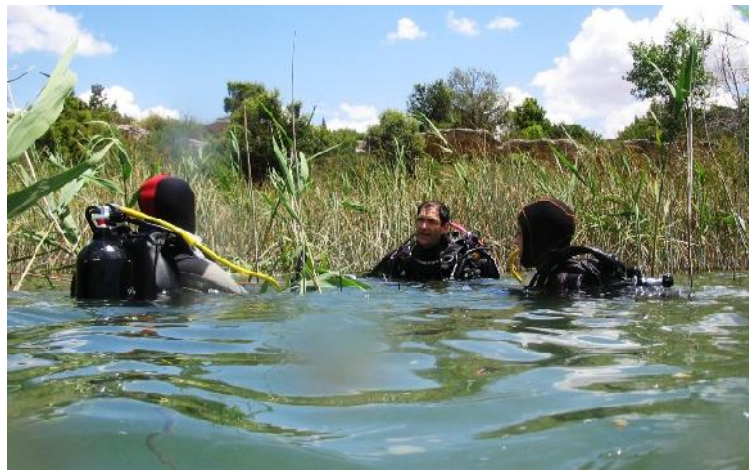
8. Interpretación en la laguna Tinaja (P.N. Lag. Ruidera. Ciudad Real)

Como en ejercicios anteriores, este año se volverán a realizar actividades de interpretación en las lagunas del Ocelo y de la Sierpe (Orense) para niños.