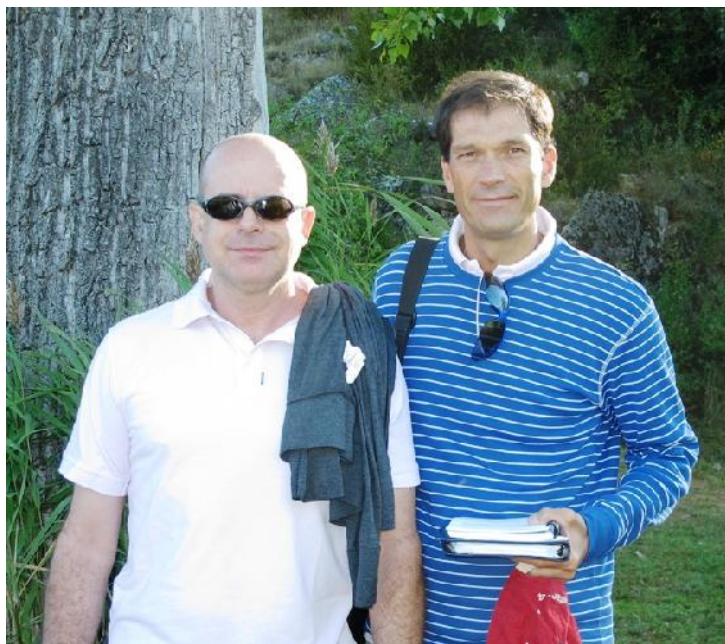
1. Nuevas personas, pero con los mismos valores de siempre

Inclusión. Entendemos que la integración de miembros de colectivos hasta ahora excluidos del mercado laboral por razones de diversidad funcional es crítica. Igualmente, tenemos en cuenta, en todos nuestros procesos y servicios, aspectos relativos a la accesibilidad y al diseño para todos.